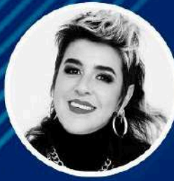
Amparo Sánchez (Amparanoia)