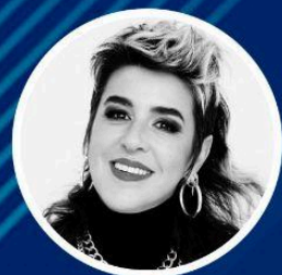
Amparo Sánchez (Amparanoia)